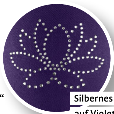
Silbernes Motiv „Seerose“ auf Violett