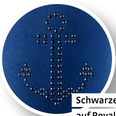
Schwarzes Motiv „Anker“ auf Royalblau